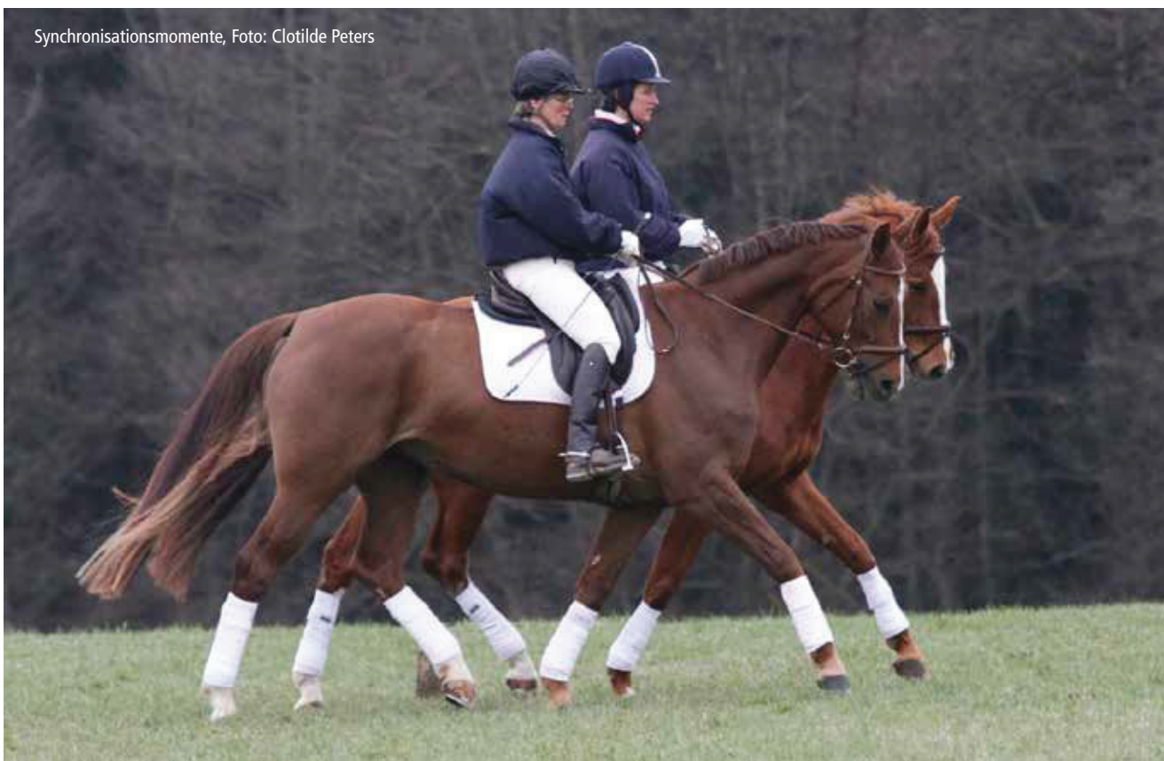
Synchronisationsmomente, Foto: Clotilde Peters

„S. hat viel mehr Kontakt zu ihren Gefühlen, sie kriegt jetzt mit: Abschied, da weint sie. Und - sie ist irgendwie ganz emotional geworden, das ist ganz schön, ich glaube, weil sie mit dem Pferd so etwas Körpernahes hatte, was ihr bislang aus ihrer Lebensgeschichte heraus gefehlt hat.“ (B. v.M.)