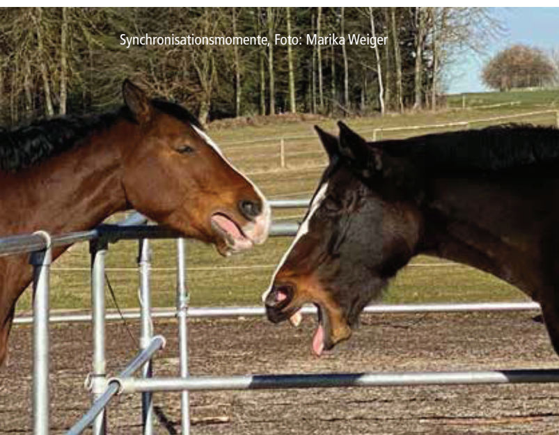
Synchronisationsmomente, Foto: Marika Weiger

le aktiv sind, wie bei demjenigen, der die beobachtete Handlung vornimmt. Sie bilden die neurobiologische Basis des Synchronismus, der Gefühlsansteckung und der Perspektivübernahme - letztlich auch der Empathiefähigkeit und der Intersubjektivität.